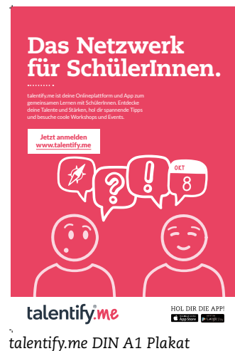
talentify.me DIN A1 Plakat