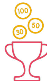
talentify.me Profil eines Schülers